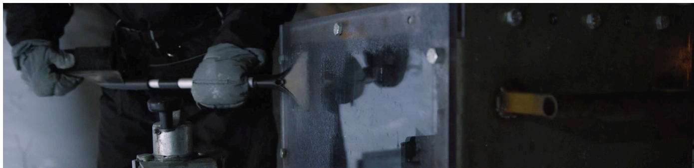
在冬天进行拍摄对拍摄团队来说并非没有挑战。