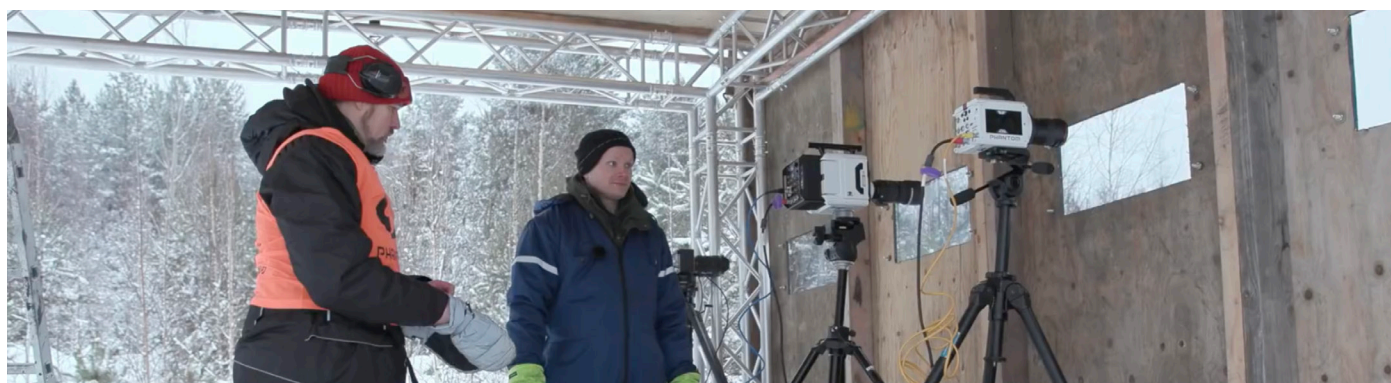
在安全掩蔽所中设置 Phantom TMX 7510 和 T3610。

除了使用许多标准摄像机和 GoPros 以从不同角度捕捉事件之外, Granberg 还在聚碳酸酯玻璃窗后面的掩蔽所内设置了两台 Phantom 高速摄像机——TMX 7510 (单色) 和 T3610 (彩色)。第三台高速摄像机, 即 Phantom v2640 (彩色), 被装在一个金属盒子内, 并用起重机吊起。他的计划是利用摄像机机身上的设置, 手动触发掩蔽所里的两台摄像机, 并通过遥控电线触发起重机上的摄像机。额外的照明是几个大功率、无闪烁的 LED 灯, 它们是由 Easy LED 公司提供的, 以照亮汽车周围的区域。