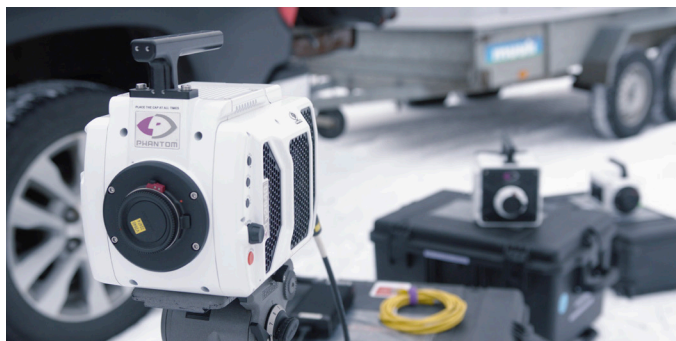
Granberg 和他的团队使用了一台 Phantom TMX 7510、T3610 和 v2640, v2640 不幸在断电时光荣牺牲了。

像 TMX 7510 这样的高速摄像机集成了极端动态范围 (EDR), 这一功能使高速专家能够在黑暗和光明之间快速切换曝光时间, 以捕捉爆炸以及爆炸前后的事件。然而, 遗憾的是, 由于项目的时间紧迫, Granberg 没有足够的时间来测试这个有趣的功能。“理想情况下, 我们会用一些较小的爆炸进行一些测试, 以了解我们需要控制多少 EDR。”