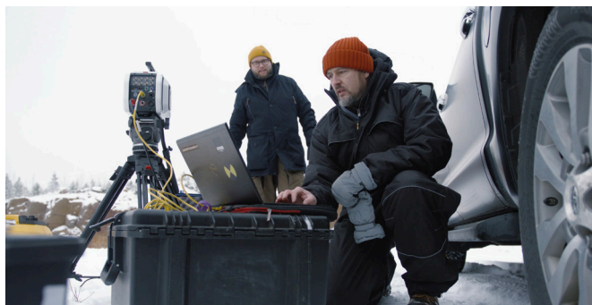
在爆炸现场配置 Phantom 摄像机。