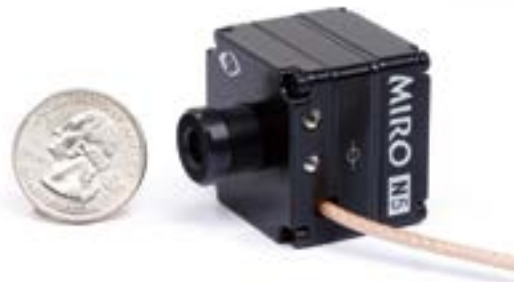
Miro N5 机头连接到其中一款底座上