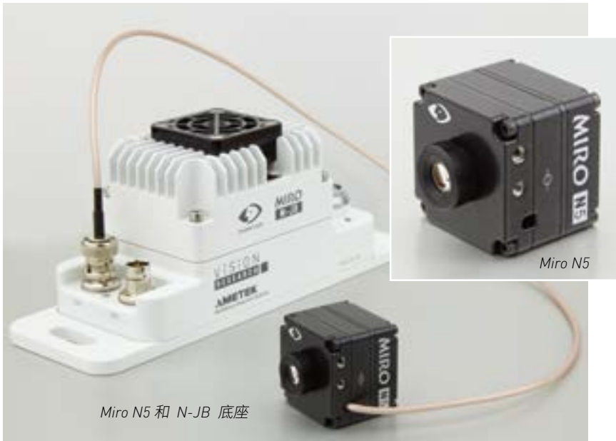
Miro N5 和 N-JB 底座